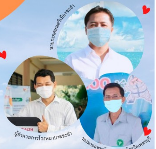
นายกเทศมนตรีเมืองชะอำ

กองสาธารณสุขและสิ่งแวดล้อม เทศบาลเมืองชะอำ โทร.032-471221